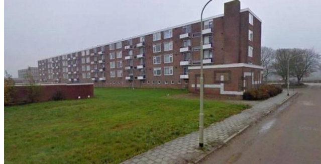
achterzijde Balticflat vanaf de Finsestraat