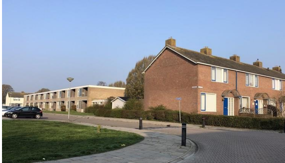
hoek Huibertstraat / Koningsstraat

In maart van 2019 is duidelijk geworden dat de batch 1588 in uitvoering kan. Voor Delfzijl betekent dit dat er 527 woningen (386 huur en 141 koopwoningen) vallen onder de versterkingsoperatie. In de zomer van 2020 werd bekend dat ook Zandplatenbuurt Zuid dezelfde versterkingsdeal krijgt als Zandplatenbuurt Noord (batch 1588). Hierdoor wordt de opgave uitgebreid van 527 huishoudens naar 870 huishoudens. Uitgangspunt in Delfzijl is sloop – nieuwbouw.